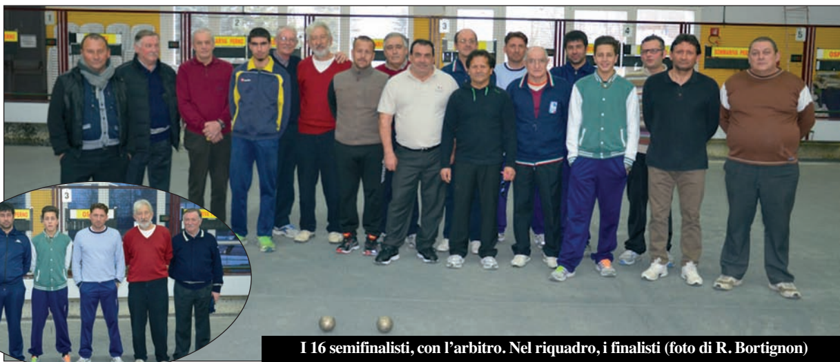
I 16 semifinalisti, con l'arbitro. Nel riquadro, i finalisti

Notevole successo ha riscosso la grande "Gara del Roero", organizzata dalla Bocciofila di Sommariva Perno nei mesi dicembre-febbraio e conclusasi con la finale di sabato 21 febbraio. I partecipanti alla gara sono stati ben 256 a riprova dell'apprezzamento che la nostra Bocciofila ha presso molti appassionati, provenienti da tutta la regione.