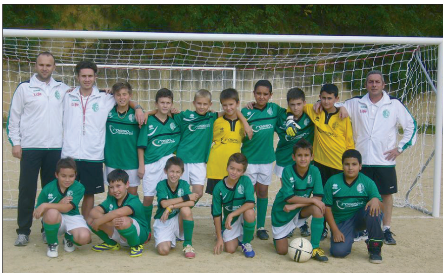
La squadra degli Esordienti