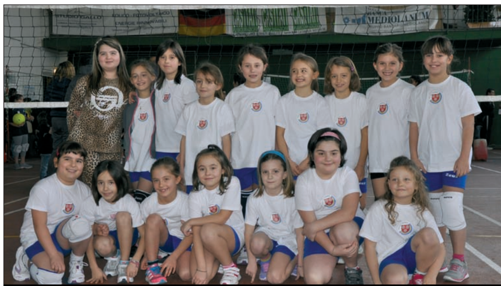
Le simpatiche e sorridenti speranze del volley sommarivese