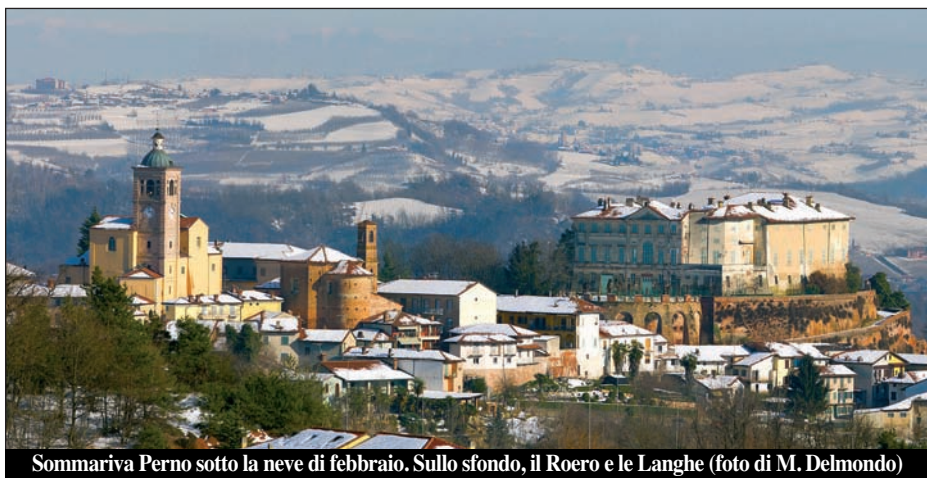
Sommariva Perno sotto la neve di febbraio. Sullo sfondo, il Roero e le Langhe

l'intervento immediato del Comune. Proprio per prevenire questi problemi (ma purtroppo, quest'anno non è servito), da gennaio è in vigore una ordinanza del sindaco che impone il taglio di alberi, rami, siepi, arbusti lungo tutto il tratto di Strada Aiatta (che parte dall'incrocio con strada Barbieri fino all'incrocio con la strada che porta ai primi pozzi nell'Aiatta) e di Strada Sappelletto, che va fino al pozzo del consorzio Aiatta. I proprietari dei boschi che confinano con queste strade sono obbligati entro il mese di aprile a tagliare tutto quanto può cadere sul sedime stradale: i rami delle piante sporgenti oltre il limite esterno della cunetta o, in mancanza di essa, della banchina stradale; devono inoltre abbattere tutti gli alberi secchi, pericolosi o pendenti verso la sede stradale fino alla distanza corrispondente all'altezza della chioma che intralciano la visibilità o manifestano pericolo di