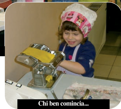
Chi ben comincia...

che si pensa di fare nei prossimi mesi, mentre non si riuscirà ad organizzare il mercatino alla festa delle fragole. Se c'è materiale, si farà però per Santa Croce.