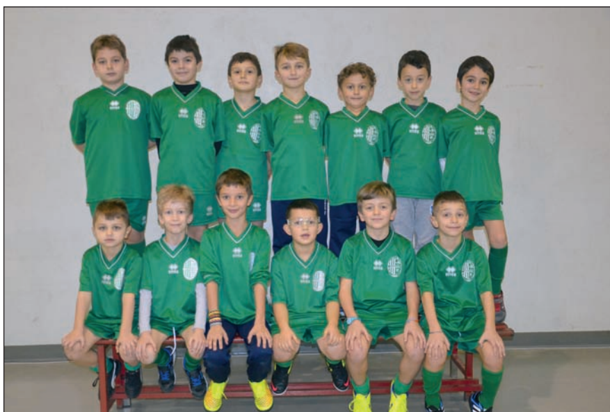
La squadra dei Pulcini 1° anno