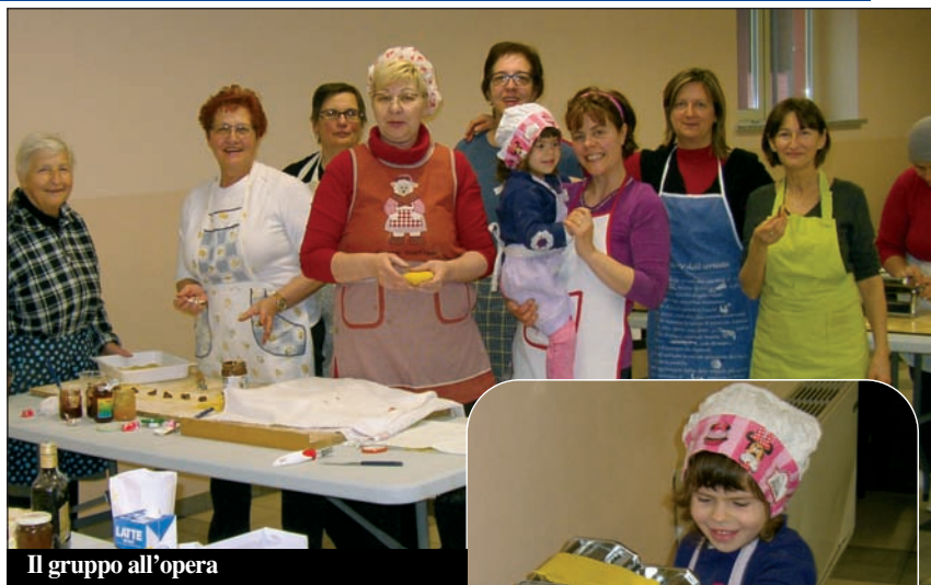
Il gruppo all'opera

fare queste giornate a tutte le persone che si mettono simpaticamente in gioco per la realizzazione di piatti e pietanze semplici e tradizionali, che così non vanno perduti. Queste sono per ora le proposte