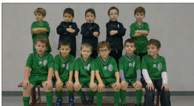
Il gruppo dei Piccoli Amici