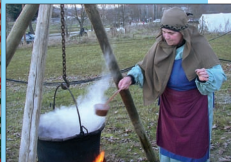
I lavori e i gruppi premiati di Sommariva Perno e immagini del Presepe vivente 2014