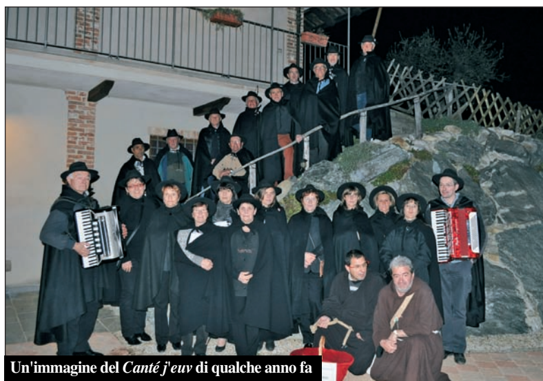
Un'immagine del Canté j'euiv di qualche anno fa

Sabato 7 marzo, presso il Bar del CSR il Gruppo Cui dra fròla 'd Sumariva ha iniziato il tour del "Canté j'euiv 2015" con una bella festa in allegria. Gli altri appuntamenti saranno sabato 14 e sabato 21 marzo all'Acli di Valle Rossi e all'Acli di San Giuseppe. Poi, tutti al grande appuntamento finale in programma a Valpone di Canale sabato 28 marzo.