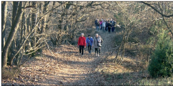
Un momento della passeggiata sul "sentiero dei presepi", il 4 gennaio

Il ciclo di incontri "Tra storia e storie", che il Centro culturale San Bernardino ha deciso di proporre tra novembre 2014 e aprile 2015 per ricordare i 100 anni della Prima Guerra Mondiale e i 70 anni della "battaglia di Sommariva Perno", è ripreso il 20 febbraio con un incontro per ripercorrere la storia di Sommariva Perno da fine '800 (morte della Bela Rosin) agli anni '20 del secolo scorso. Il secondo si terrà in San Bernardino il