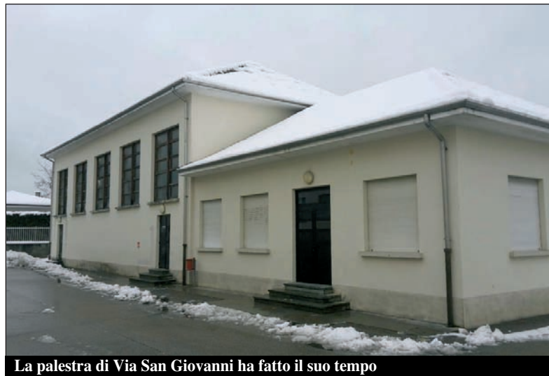
La palestra di Via San Giovanni ha fatto il suo tempo

Ancora una volta, dunque, la scuola sarà al centro delle attenzioni dell'Amministrazione comunale, perché è lì che si formano i futuri cittadini sommarivesi. C'è un progetto dell'arch. Rossella Cuncu di Ceva, presentato in Regione a febbraio, nell'ambito del Piano Triennale di Edilizia Scolastica 2015-2017 emanato dallo Stato in data 21 gennaio. Come si vede, in tempi record siamo riusciti a produrre un progetto che, una volta realizzato, cambierà totalmente l'area delle scuole. Prevede infatti innanzitutto l'abbattimento della vecchia palestra (ha quasi 50 anni, e li dimostra tutti se non di più), i cui costi di manutenzione straordinaria, adeguamento e messa in sicurezza sarebbero molto alti, e poi la costruzione di una nuova palestra strutturalmente collegata all'attuale edificio scolastico lungo l'asse di Via Ceretta (così gli alunni non dovranno più uscire dall'edificio principale per andare in palestra). E' prevista una costruzione su due piani, con tutti gli accorgimenti per renderla efficiente al massimo sul piano energetico. Il pianterreno sarà "a vista", cioè