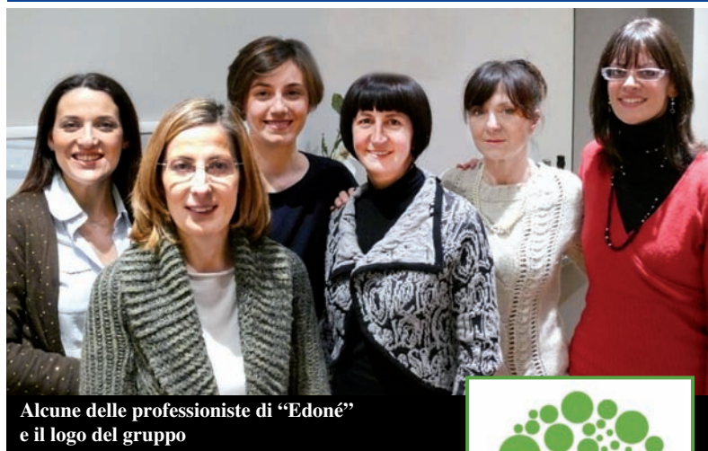
Alcune delle professioniste di "Edoné" e il logo del gruppo