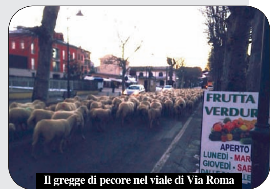
Il gregge di pecore nel viale di Via Roma